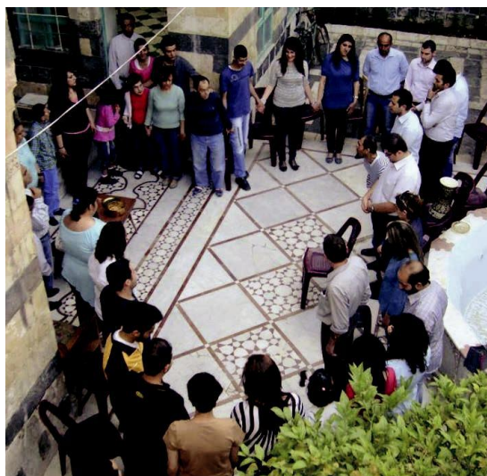
Zajednica Arka Al-Safina Dan posta i molitve za mir u Siriji

B og je žedan jedinstva, on čezne da ujedini svu djecu Božju koja su raspršena. On čezne da sruši zidove koji nas razdvajaju jedne od drugih, tako da život može izići van. Bog plače pred podjelom. Bog želi da slavimo jedinstvo, i da radimo ponizno i siromašno za jedinstvo. Ovaj Bog je tako skriven iza sve te buke i stresa naših društava. On je tamo, On čeka, On čeka na susret, On čeka na mene, On čeka na svakog od nas. Molimo zajedno za naš svijet u boli.